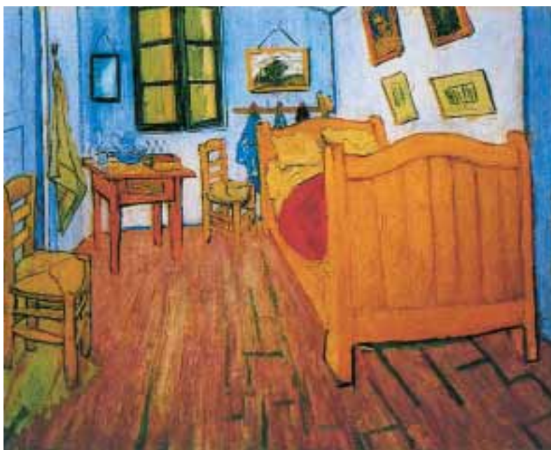
VAN GOGH MUSEUM, AMSTERDAM