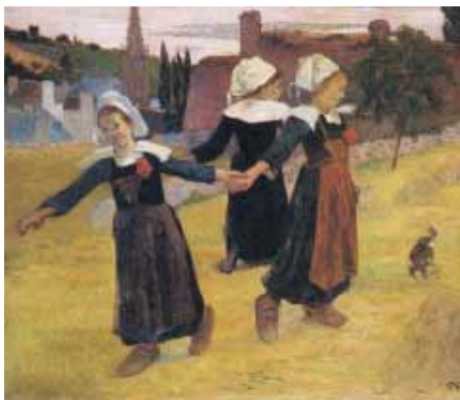
GALERIA NACIONAL DE ARTE, WASHINGTON, DC